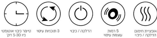
טיימר כיבוי אוטומטי בין 5-30 דק 3 תוכניות עיסוי הדלקה / כיבוי 5 רמות עוצמת עיסוי אופציות חימום הדלקה / כיבוי